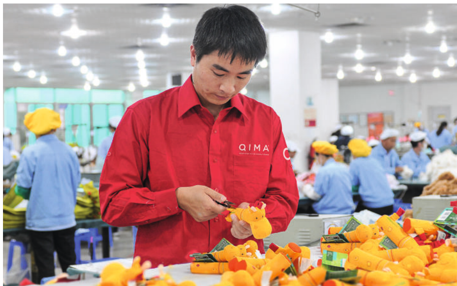
Un employé de Qima inspecte un lot de peluches girafes. En plus des biens de consommation, l'entreprise couvre aussi l'alimentaire, et depuis cinq ans, la pharmacie et la cosmétique.